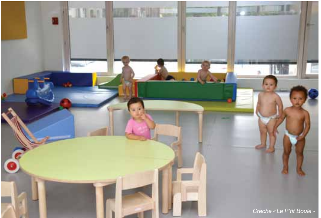
Crèche « Le P'tit Boule »