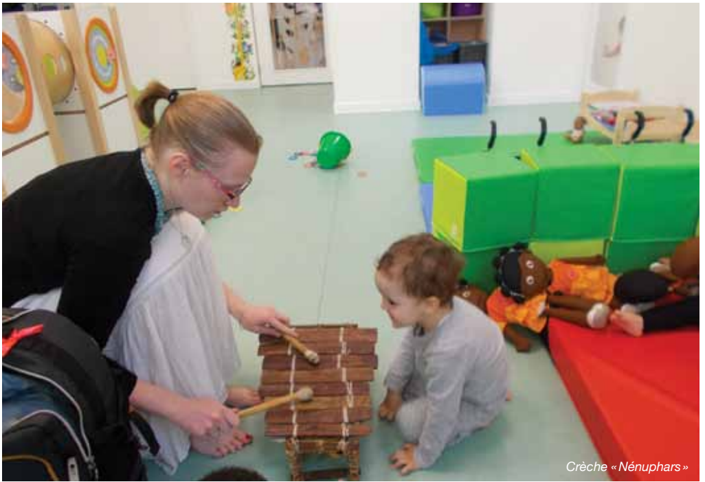
Crèche « Nénuphars »